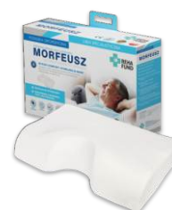
Morfeusz do terapii bezdechu sennego 665