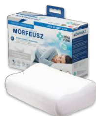
Morfeusz Delikatny 664