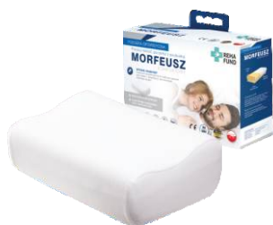
Morfeusz Komfortowy 661

Dla klientów, którzy nie zmagają się z większymi problemami z odcinkiem szyjnym kręgosłupa, popularna zarówno wśród kobiet, jak i mężczyzn.