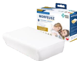
Morfeusz Ekskluzywny 662