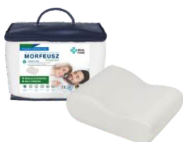
Morfeusz Podróżny 663

Dla klientów bez schorzeń kręgosłupa, wybierana często jako pierwsza poduszka ortopedyczna, także na prezent dla bliskich, częściej wybierana przez kobiety.