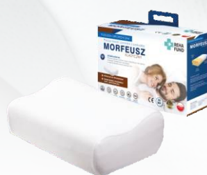
Morfeusz Klasyczny 660

Dla klientów ze zdiagnozowanymi chorobami odcinka szyjnego kręgosłupa, częściej wybierana przez mężczyzn.